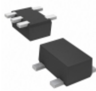
DMG563H10R Panasonic TRANS PREBIAS NPN/PNP SMINI5