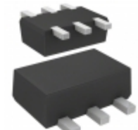
DMG504010R Panasonic TRANS NPN/PNP 50V 0.1A SMINI6