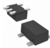
DMG563020R Panasonic TRANS PREBIAS NPN/PNP SMINI5