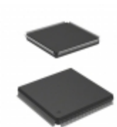
AT94K05AL-25DQI Microchip Technology IC FPSLIC 5K GATE 25MHZ 208QFP