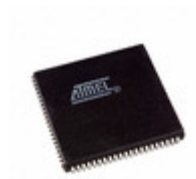
AT94K05AL-25AJI Microchip Technology IC FPSLIC 5K GATE 25MHZ 84PLCC