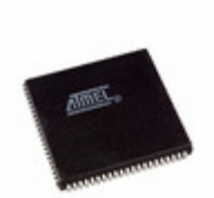
AT94K10AL-25AJC Microchip Technology IC FPSLIC 10K GATE 25MHZ 84PLCC