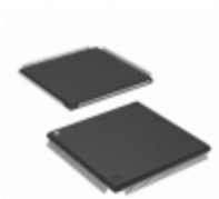
AT94K05AL-25BQI Microchip Technology IC FPSLIC 5K GATE 25MHZ 144LQFP