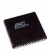
AT94K05AL-25AJC Microchip Technology IC FPSLIC 5K GATE 25MHZ 84PLCC