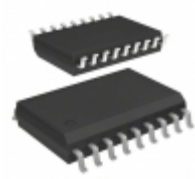
M41T83SMY6F STMicroelectronics IC RTC CLK/CALENDAR I2C 18-SOX