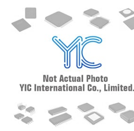
AT29LV010-25TC ATEL AT29LV010-25TC ATEML