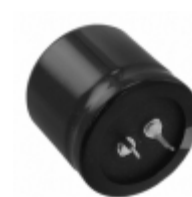
EET-ED2D102EA Panasonic Electronic Components CAP ALUM 1000UF 20% 200V SNAP