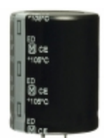
EET-ED2D182EA Panasonic Electronic Components CAP ALUM 1800UF 20% 200V SNAP