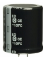
EET-ED2D152EA Panasonic Electronic Components CAP ALUM 1500UF 20% 200V SNAP