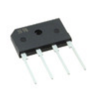
TS6K80 D3G TSC (Taiwan Semiconductor) BRIDGE RECT 1PHASE 800V 6A TS4K