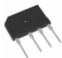
TS6P03G C2G TSC (Taiwan Semiconductor) BRIDGE RECT 1PHASE 200V 6A TS-6P