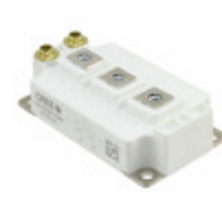
CAS300M17BM2 Cree/Wolfspeed MOSFET 2N-CH 1700V 325A MODULE