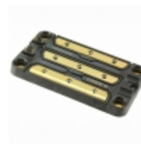
CAS325M12HM2 Cree Wolfspeed MOSFET 2N-CH 1200V 444A MODULE