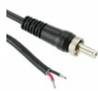
CAS761KS07984 Conxall / Switchcraft SEALED DC POWER CABLE ASSY, 0.08