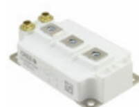
CAS300M17BM2 Cree Wolfspeed MOSFET 2N-CH 1700V 325A MODULE