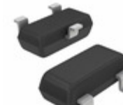
DTB123YCHZGT116 LAPIS Semiconductor PNP -500MA -50V DIGITAL TRANSIST