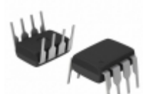
BR24G256-3 Rohm Semiconductor IC EEPROM 256KBIT 400MHZ 8DIP