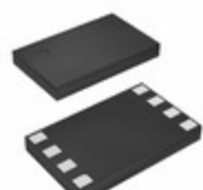
BR24G16QUZ-3TR LAPIS Semiconductor I 2 C BUS EEPROM (2-WIRE)