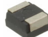
2R5TPE220MLB Panasonic Electronic Components CAP TANT POLY 220UF 2.5V 1411