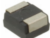
2R5TPE220MIB Panasonic Electronic Components CAP TANT POLY 220UF 2.5V 1411