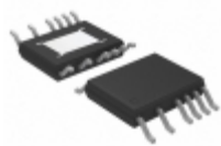
LTC7138IMSE#TRPBF Linear Technology IC REG BUCK BST INV 0.4A 16MSOP