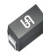
1SMA5944HR3G TSC (Taiwan Semiconductor) DIODE ZENER 62V 1.5W DO214AC