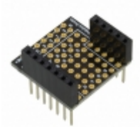
RFD22125 RF Digital RFDUINO PROTO SHIELD