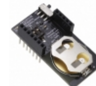
RFD22128 RF Digital RFDUINO CR2032 SHIELD