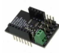
RFD22123 RF Digital RFDUINO SERVO SHIELD