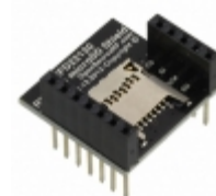
RFD22130 RF Digital RFDUINO MICROSD SHIELD