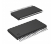
BU9797FUV-E2 Rohm Semiconductor IC LCD DVR 144SEGMENT 48TSSOP