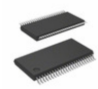
BU9797FUV-ME2 LAPIS Semiconductor STANDARD LCD SEGMENT DRIVER