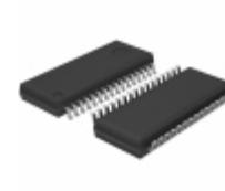
BU9796FS-E2 Rohm Semiconductor IC LCD DVR MULTI 20X4COM 32-SSOP