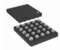
ICE40LM2K-SWG25TR1K Lattice Semiconductor Corporation IC FPGA 18 I/O 25WLCSP