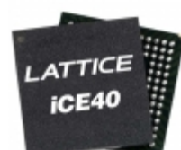
ICE40LM2K-CM36TR1K Lattice Semiconductor Corporation IC FPGA 28 I/O 36UCBGA