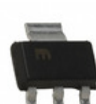
MIC5200-3.0BS TR Microchip Technology IC REG LDO 3V 0.1A SOT223