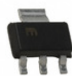
MIC5200-3.0YS Microchip Technology IC REG LDO 3V 0.1A SOT223