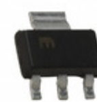
MIC5200-3.0YS-TR Microchip Technology IC REG LDO 3V 0.1A SOT223