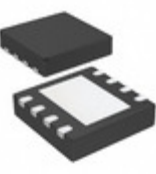
MCP4541T-502E/MF Microchip Technology IC DGTL POT 5K 129TAPS 8-DFN