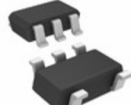
TSH80IYLT STMicroelectronics IC OPAMP GP 65MHZ RRO SOT23-5