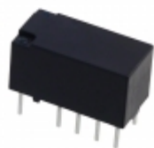
TX2-6V Panasonic Electric Works RELAY TELECOM DPDT 2A 6V