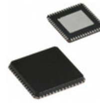
CY7C65640A-LFXC Cypress Semiconductor Corp IC USB HUB CONTROLLER HS 56VQFN