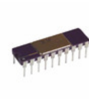
AD630AD Analog Devices Inc. IC MOD/DEMODO BAL 2MHZ 20-CDIP