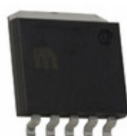
MIC37301-2.5WR-TR Microchip Technology IC REG LDO 2.5V 3A SPAK-5