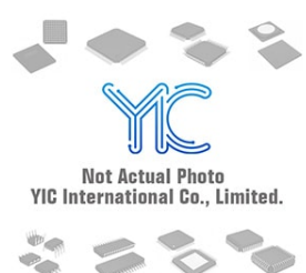
MIC37301-3.3WRTR MICREL MICREL TO263-5