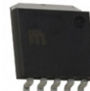
MIC37301-3.3WR-TR Microchip Technology IC REG LDO 3.3V 3A SPAK-5