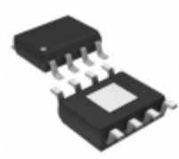
MIC37301-2.5YME Microchip Technology IC REG LDO 2.5V 3A 8SOIC