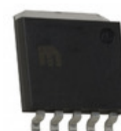
MIC37301-3.3BR Microchip Technology IC REG LDO 3.3V 3A SPAK-5