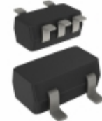
74AHCT1G86GW,165 Nexperia USA Inc. IC GATE XOR 1CH 2-INP 5-TSSOP