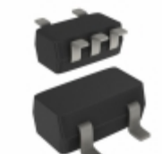
74AHCT1G86GW-Q100, Nexperia USA Inc. IC GATE XOR 1CH 2-INP 5-TSSOP