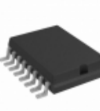
TC4469COE Micrel / Microchip Technology IC MOSFET DVR AND/INV 16SOIC