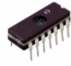
TC4468MJD Micrel / Microchip Technology IC MOSFET DVR QUAD AND 14CDIP