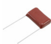
ECQ-E2225JFB Panasonic Electronic Components CAP FILM 2.2UF 5% 250VDC RADIAL