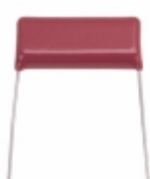
ECQ-E2225KS Panasonic Electronic Components CAP FILM 2.2UF 10% 250VDC RADIAL