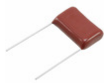
ECQ-E2225JFW Panasonic Electronic Components CAP FILM 2.2UF 5% 250VDC RADIAL