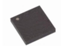
AT17LV256-10CC Microchip Technology IC SRL CONFIG EEPROM 256K LV 8LAP