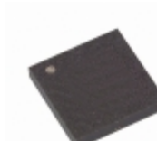
AT17LV256-10CI Microchip Technology IC SRL CONFIG EEPROM 256K 8-LAP