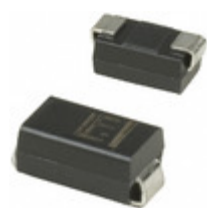
SMAJ200A Littelfuse Inc. TVS DIODE 200VWM 324VC SMA