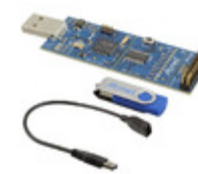
AT97SC3205P-SDK2 Micrel / Microchip Technology DEMO KIT FOR 97SC3204