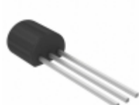
MCP1702-4002E/TO Microchip Technology IC REG LDO 4V 0.25A TO92-3