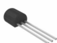
MCP1702-5002E/TO Microchip Technology IC REG LDO 5V 0.25A TO92-3