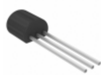
MCP1702-3602E/TO Microchip Technology IC REG LDO 3.6V 0.25A TO92-3