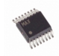
MAX7347AEE+ Maxim Integrated IC CNTRL SW SOUND 16-QSOP