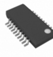
MAX7348AEP+ Maxim Integrated IC KEY SWITCH 2WIRE 20-QSOP