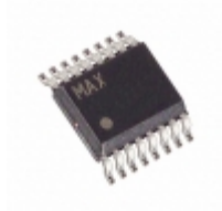
MAX7347AEE+T Maxim Integrated IC CNTRL SW SOUND 16-QSOP