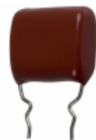
ECQ-P1H104FZW Panasonic Electronic Components CAP FILM 0.1UF 1% 50VDC RADIAL