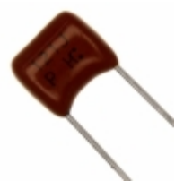
ECQ-P1H121JZ Panasonic Electronic Components CAP FILM 120PF 5% 50VDC RADIAL