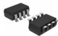
MAX4491AKA-T Maxim Integrated IC OPAMP GP 10MHZ RRO SOT23-8