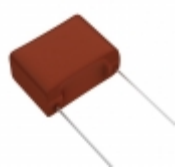
ECW-F2335JA Panasonic Electronic Components CAP FILM 3.3UF 5% 250VDC RADIAL