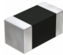
UMK105CH090DVHF Taiyo Yuden CAP