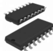
MC14014BF ON Semiconductor IC SHIFT REGISTER 8BIT 16SOEIAJ