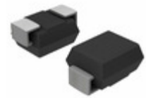
SURS8105T3G-VF01 AMI Semiconductor / ON Semiconductor DIODE GEN PURP 50V 1A SMB