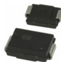
SURS340DT3G ON Semiconductor DIODE GEN PURP 400V 3A SMC