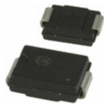
SURS360DT3G ON Semiconductor DIODE GEN PURP 600V 3A SMC