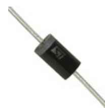
LNBTVS3-220 STMicroelectronics TVS DIODE 20VWM 35VC DO201