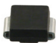
LNBTVS3-220U STMicroelectronics TVS DIODE 20VWM 35VC SMB