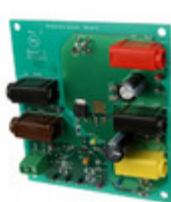
NCP102MBGEVB AMI Semiconductor / ON Semiconductor EVAL BOARD FOR NCP102MBG