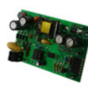
NCP1028LEDGEVB AMI Semiconductor / ON Semiconductor EVAL BOARD FOR NCP1028LEDG