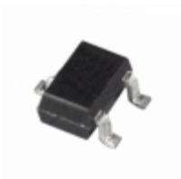
ADM809RAKS-REEL7 Analog Devices Inc. IC SUPERVISOR P/P 2.63V SC70-3