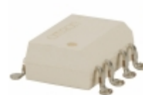
G3VM-355F(TR) Omron Electronics Inc-EMC Div RELAY SSR DPST 100MA 8PIN SMD