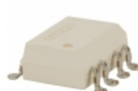
G3VM-355F Omron Electronics Inc-EMC Div RELAY SSR DPST 100MA 8-SMD