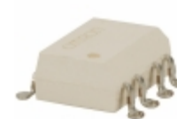
G3VM-355F Omron Electronics Inc-EMC Div RELAY SSR DPST 100MA 8-SMD