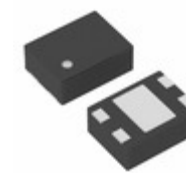
XC6108N11BGR-G Torex Semiconductor Ltd IC SUPERVISOR 1.1V 4-USP