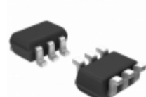
US6T5TR Rohm Semiconductor TRANS PNP 30V 2A TUMT6