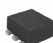
US6T7TR Rohm Semiconductor TRANS PNP 30V 1.5A TUMT6