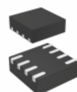
AD5620BCPZ-1RL7 Analog Devices Inc. IC DAC 12BIT SPI/SRL 8-LFCSP