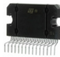
TDA7563ASMTR STMicroelectronics IC AMP QUAD MULTIFUNC FLEXIWATT2