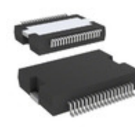
TDA7563APDTR STMicroelectronics IC AMP QUAD MULTIFUNC POWERSO36