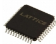
ISPLSI 2032A-110LTN44 Lattice Semiconductor Corporation IC CPLD 32MC 10NS 44TQFP