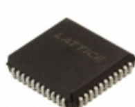
ISPLSI 2032A-135LJ44 Lattice Semiconductor Corporation IC CPLD 32MC 7.5NS 44PLCC