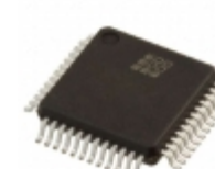
ISPLSI 2032A-110LTN48 Lattice Semiconductor Corporation IC CPLD 32MC 10NS 48TQFP