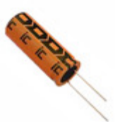
476TXK250M Illinois Capacitor CAP ALUM 47UF 20% 250V RADIAL