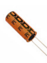
476TXK200M Illinois Capacitor CAP ALUM 47UF 20% 200V RADIAL