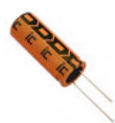
476TXK400M Illinois Capacitor CAP ALUM 47UF 20% 400V RADIAL