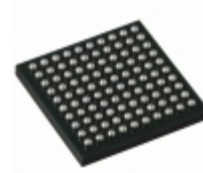
GS2960AIBE3 Semtech Corporation IC SERIALIZER SMPTE 100BGA