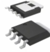
PSMN2R9-25YLC,115 Nexperia USA Inc. MOSFET N-CH 25V 100A LFPAK