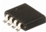
PSMN2R9-30MLC,115 Nexperia USA Inc. MOSFET N-CH 30V 70A LFPAK33