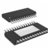
IS31AP2110-ZLS2-TR ISSI, Integrated Silicon Solution Inc IC AUDIO AMP 20W CLSS D 28TSSOP