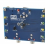
IS31AP4066D-QFLS2-EB ISSI (Integrated Silicon Solution, Inc.) EVAL BOARD FOR IS31AP4066D-QFLS2