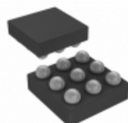
IS31AP2145A-UTLS2-TR ISSI, Integrated Silicon Solution Inc IC AUDIO AMP MONO 2.9W 9UTQFN