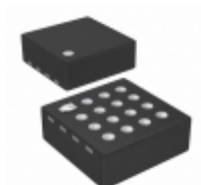
IS31AP2036A-CLS2-TR ISSI, Integrated Silicon Solution Inc HIGH POWER, ULTRA-LOW EMI