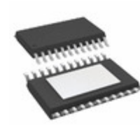
IS31AP2111-ZLS1 ISSI, Integrated Silicon Solution Inc IC AUDIO AMP 20W CLSS D 24TSSOP