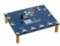
IS31AP2145A-UTLS2-EB ISSI (Integrated Silicon Solution, Inc.) EVAL BOARD FOR IS31AP2145A-UTLS2