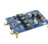
IS31AP2111-ZLS1-EB ISSI (Integrated Silicon Solution, Inc.) EVAL BOARD FOR IS31AP2111