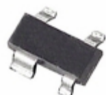
ADM6315-45D4ARTRL7 Analog Devices Inc. IC SUPERVISOR OD 4.50V SOT143