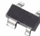
ADM6315-46D1ARTRL7 Analog Devices Inc. IC SUPERVISOR OD 4.63V SOT143