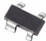
ADM6315-46D2ART-RL Analog Devices Inc. IC SUPERVISOR OD 4.63V SOT143