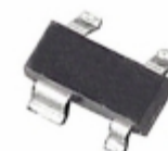
ADM6315-45D3ARTRL7 Analog Devices Inc. IC SUPERVISOR OD 4.50V SOT143